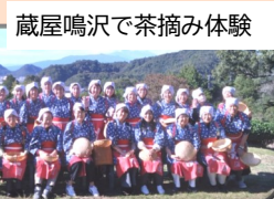
蔵屋鳴沢で茶摘み体験