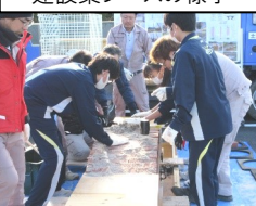
建設業ブースの様子

伊豆の国市近隣の33事業所が出展し、中学1・2年生154名に各業種の仕事を紹介しました。生徒は事前に出展者一覧を見て話を聞きたい3つの業種を選択し、職業フェア当日に30分毎、区切られた時間割でブースをまわりました。各ブースでは専門的な内容を生徒にわかりやすく説明する為に映像や体験を用いるなど工夫をされていました。体験ブースでは、調理師ブースでは出汁巻き卵作り体験、消防ブースによるポンプ車放水体験、ラジオ局ブースでパーソナリティ体験、一般建設業ブースでは石造りアーチ橋の施工体験、などが行われ大好評でした。