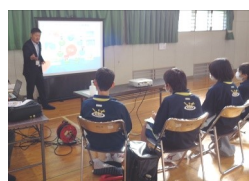
金融サービス業ブースの様子

伊豆の国市近隣の33事業所が出展し、中学1・2年生154名に各業種の仕事を紹介しました。生徒は事前に出展者一覧を見て話を聞きたい3つの業種を選択し、職業フェア当日に30分毎、区切られた時間割でブースをまわりました。各ブースでは専門的な内容を生徒にわかりやすく説明する為に映像や体験を用いるなど工夫をされていました。体験ブースでは、調理師ブースでは出汁巻き卵作り体験、消防ブースによるポンプ車放水体験、ラジオ局ブースでパーソナリティ体験、一般建設業ブースでは石造りアーチ橋の施工体験、などが行われ大好評でした。