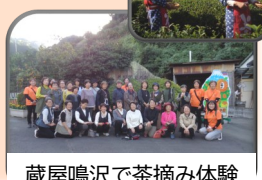
蔵屋鳴沢で茶摘み体験