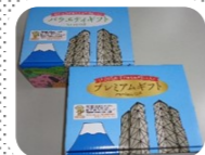
女性部オススメ伊豆の国 ブランドギフトセット