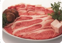
あしたか牛焼肉セット