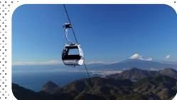
伊豆パノラマパークロープウェイ